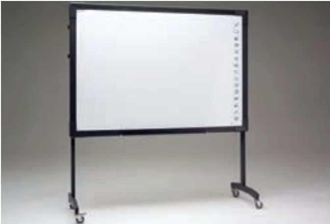
IBOARD (FÅES I 58", 77", 88", 100")